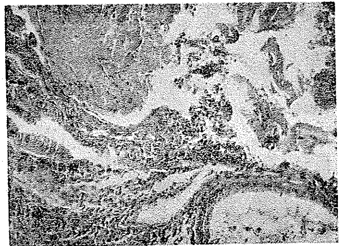
شکل ۲- در سمت راست و پائین تصویر جدار کیستی مشاهده میشود که از سلولهای استوانه‌ای مفروش شده است (درشت نمایی ۱۰×۱۰)

ماکروسکپی: تومور تقریباً کروی و بقطر متوسط ۲ سانتیمتر و به وزن ۴/۸۰ کیلوگرم میباشد. سطح آن دارای برجستگی و فرورفتگی است. سطح خارجی تومور را یک ورقه نازک بضخاست نیم میلیمتر پوشانده است. سطح خارجی صاف بوده اثری از چسبندگی به اعضاء مجاور در آن وجود ندارد در زیر پوشش سطحی عروق متسع دیده میشود. قوام بافت کاملاً متغیر است بدین معنی که در بعضی نقاط الاستیک و در قسمتهای دیگر کاملاً سفت است. در برش مشاهده شد که تومور در بعضی مناطق کیستیک میباشد و در داخل یکی از کیستها مایع زلال و غلیظی وجود دارد.