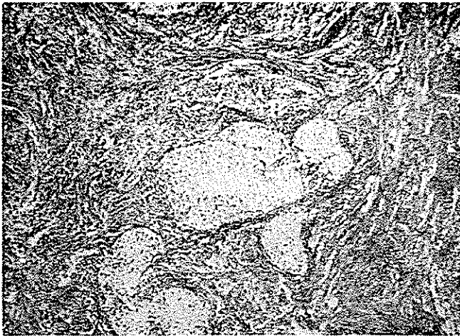
شکل ۴- عناصر فیبرومی و جزایر اپی تلیالی در این تصویر بخوبی دیده میشود (درشت نمایی ۱۰×۱۰)